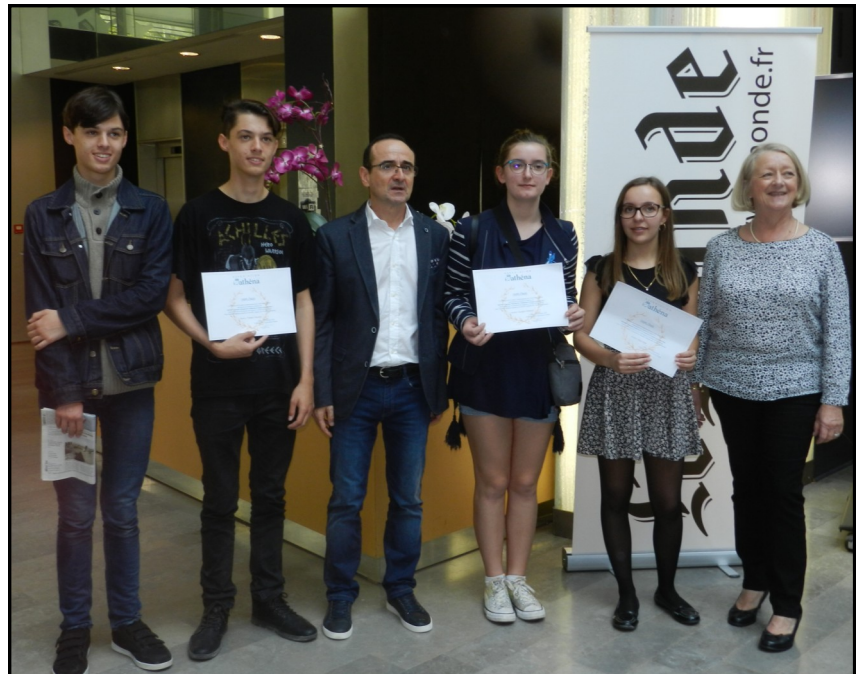
Les lauréats de Mme THERY