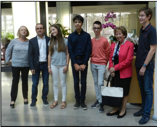
Le podium 2018