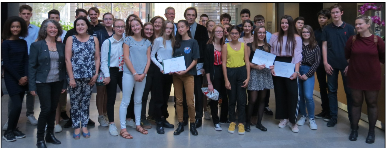
Tous réunis !