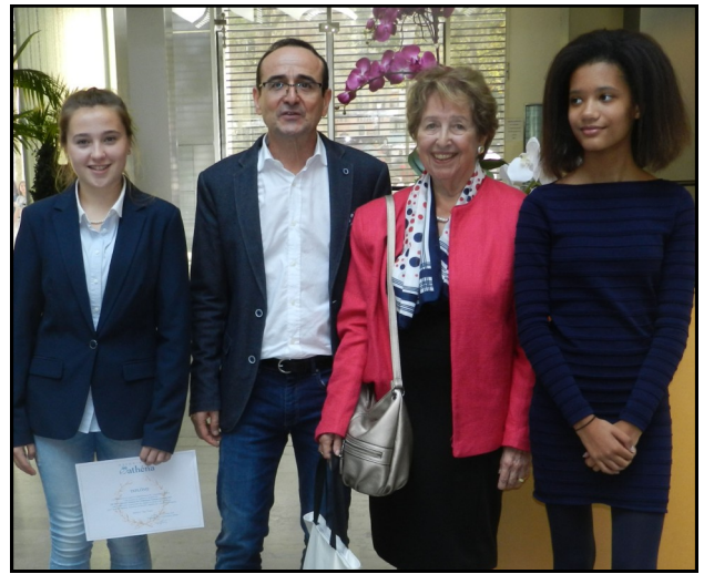
Le podium 2017