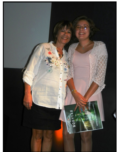
Plusieurs lauréats étaient accompagnés de leur professeur, voire de leur chef d'établissement ; et certains professeurs avaient plusieurs lauréats !